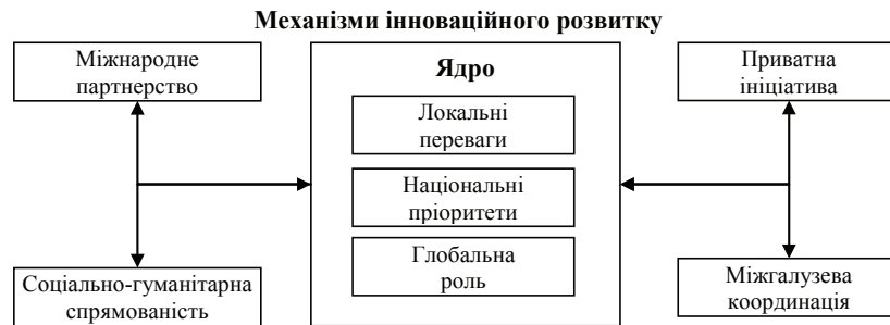
Рис. 1. Механізм інноваційного розвитку національної економіки

Схему інноваційного розвитку на основі національних факторів наведено на рис. 1. Таким чином, головним завданням в Україні є створення українського виміру інноваційної системи з відповідними пріоритетами.