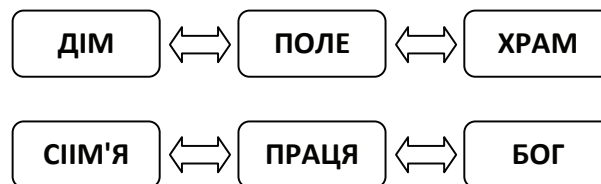
Рис. 1. Концептосфера українських архетипів у традиційному і сучасному прочитанні.

«Період Радянського Союзу сформував феномен «радянської людини» – безсуб'єктного індивіда, внутрішнє Я якого розчинилося в державно-громадському МИ», – зазначає В. Ядов [13, с. 26]. За роки незалежності відбувалося поступове руйнування інституту людини, що негативно вплинуло на розвиток здібностей і готовності (насамперед психологічної) особистості до самоврядування й самоорганізації, заснованих на раціональному (у функціональному та сутнісному аспектах) впливі особистості на внутрішній і зовнішній світ для реалізації своїх прав та інтересів без утискання прав та інтересів інших людей. Якщо врахувати, що свідомість українців будується головним чином на традиції, а отже, на культурно-історичному досвіді предків, ментальному та емоційно-психологічному кодів, архетипні засади виступають дієвим механізмом саморегуляції і сталості внутрішньої картини світу сучасного українця в умовах посилення нестабільності. Архетипні засади українського народу вибудовуються, згідно з дослідженнями С. Кримського [14], на підґрунті концептосфери українських архетипів «Дім – Поле – Храм», які споконвіку виступали смисложиттєвою константою ментальності українців. Проводячи аналогію, ми пропонуємо розглянути сучасне прочитання сенсів цієї тріади як «Сім'я – Праця – Бог».