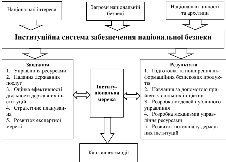
Рис. 1. Формування інституційних мереж у контексті безпекового підходу

Відповідно до класичного підходу, викладеного у дослідженні [15], структурний капітал містить у собі клієнтський і організаційний капітал.