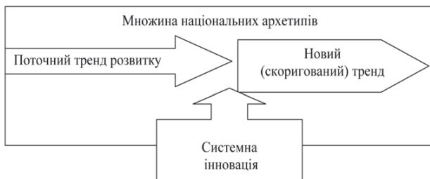
Рис. 1. Вплив системних інновацій на розвиток системи (розроблено автором)

На рис 1 показано схему впливу, виходячи зі співвідношення «традиційне – цілеспрямоване». Відповідно, чим більше системна інновація відповідатиме національній (або цивілізаційній) ідеї, що може об'єднати суспільство, тим більшою є енергія синергії, яку можна використати для побудови якісно нової держави.